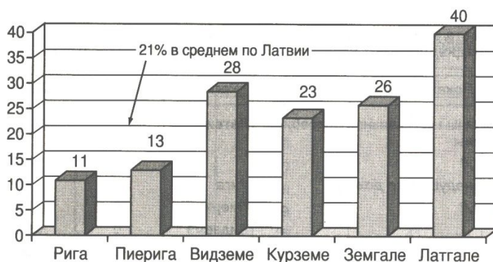
Рис. 2. Индекс риска бедности в Латвии и регионах в 2007 г. (%)

такой показатель, как "риск бедности", которому подвергаются все те, чьи доходы меньше 60% от среднего уровня доходов населения территории. В Латвии, в 2007 г. 21 % жителей были подвержены "рисуку бедности", а к исходу 2008 г. - уже 26% жителей*. Анализ показывает, что уровень бедности в Латвии имеет выраженные региональные различия. Так, наибольшее количество жителей, подверженных риску бедности, находится в Латгальском регионе, а наименьшее - в Рижском (см. рис. 2).