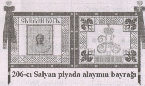
206-cı Salyan piyada alayının bayrağı

Baxmayaraq ki, xidməti binalar və əsgər qışlaları rus ordusunun hərbi hissəsi üçün tikilmişdi, həmin binaların layihələndirilməsində milli arxitektura elementlərindən də istifadə edilib. Xüsusən, bu binaların pəncərə yerləri şərq üslubunda layihələndirilib ki, bu da həmin binalara baxımlılıq, yaraşq verir. Binaların divarlarının eni bir metrə yaxındır. Bu divarların tikintisində əhəngdən və Bakı ətrafında istehsal olunan tikinti materiallarından istifadə edilib. Divarlar bayır və içəri tərəfdən yonulmuş