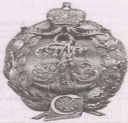
206-cı Salyan piyada alayı zabitlərinin döş nişanı

Salyan alayı başlanğıcda İçərişəhərdə yerləşmişdi. Bu alayın şəxsi heyətinin ibadətə məşğul olması üçün Qız qalası yaxınlığında Möcüzəyaradan müqəddəs Nikolay kilsəsi tikilmişdi. Həmin kilsənin Bakıda ilk pravoslav kilsəsi olması ehtimal edilir.